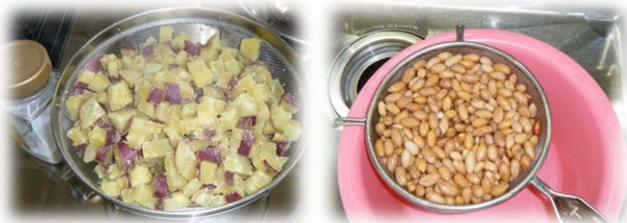
塩ゆでしたサツマイモと落花生

収穫したサツマイモと落花生は文化祭展示・模擬店の部（11月23日）で池尻小学校1年生のみなさんに振る舞います。