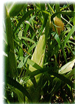
トウモロコシの実も立派になってきました