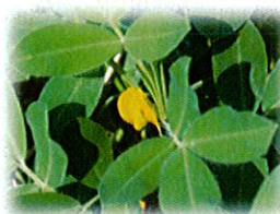
バジルの花が咲きました